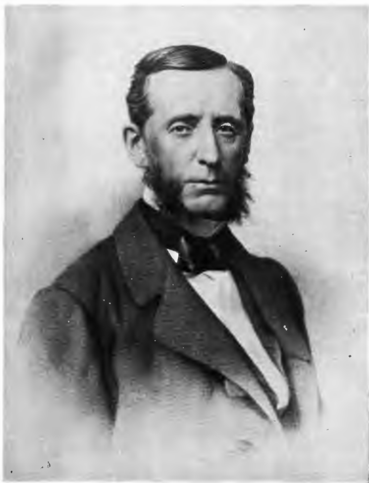
П. А. ВАЛУЕВ